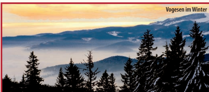
Vogesen im Winter

4. Tag: Am Neujahrstag führt eine Rundfahrt noch einmal in die Höhenlagen der Vogesen . Vom Odilienberg bietet sich ein unvergleichlicher Ausblick auf die bezaubernde Landschaft. Nach einer Führung durch das berühmte Kloster und anschließendem Kaffee und Kuchen geht es zurück ins Hotel.