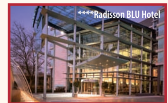
RADISSON BLU HOTEL

****Radisson BLU Hotel , wo Sie am Nachmittag Ihre Zimmer beziehen. Dann bleibt Zeit für einen Spaziergang oder zum Entspannen Wellnessbereich des Hotels. Das Abendessen in einem urigen Kölner Brauhaus lässt den Tag mit typisch rheinischer Gemütlichkeit ausklingen.