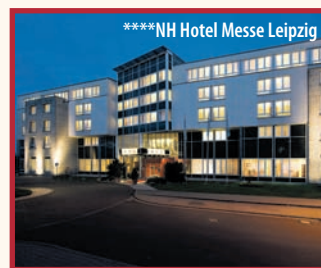
****NH Hotel Messe Leipzig

2. Tag: Am Vormittag bleibt Zeit und Muße, den Neujahrbrunch im Hotel zu genießen.