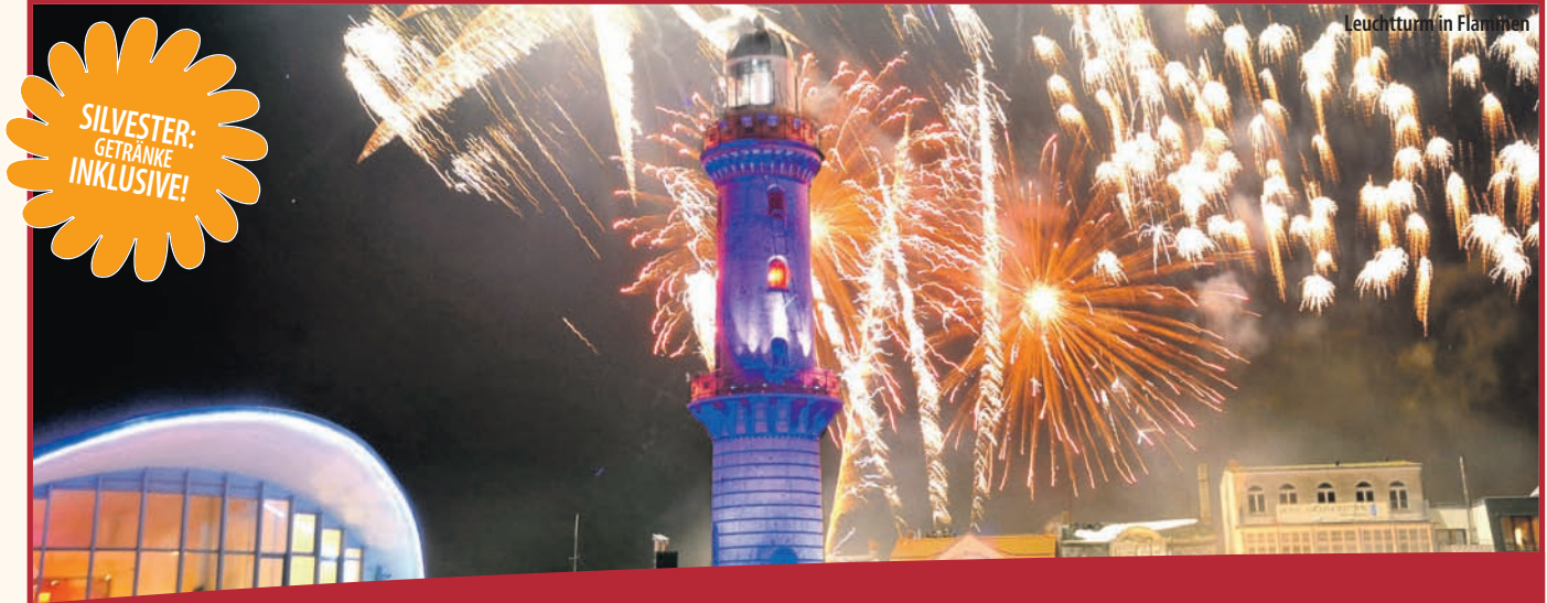
Leuchtturm in Flammen