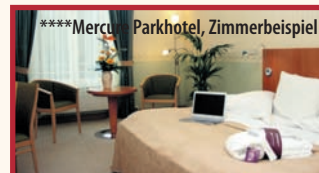
****Mercure Parkhotel, Zimmerbeispiel