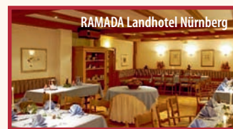
RAMADA Landhotel Nürnberg