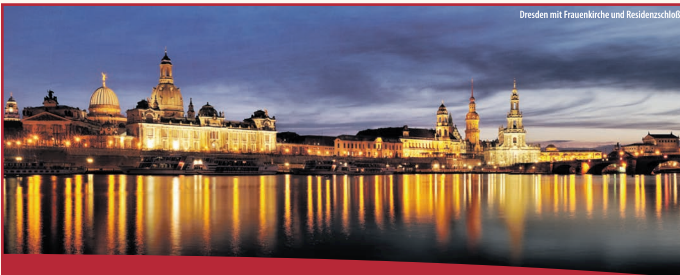
Dresden mit Frauenkirche und Residenzschloß

Das Weihnachtsoratorium von J. S. Bach in Dresdens monumentaler Frauenkirche erklingt in diesem Jahr am 2. und 3. Advent. Das festlich geschmückte Elbflorenz erwarten Sie ebenso wie ein spannendes Rahmenprogramm, das Ihnen Meißen