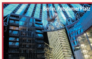
Berlin, Potsdamer Platz