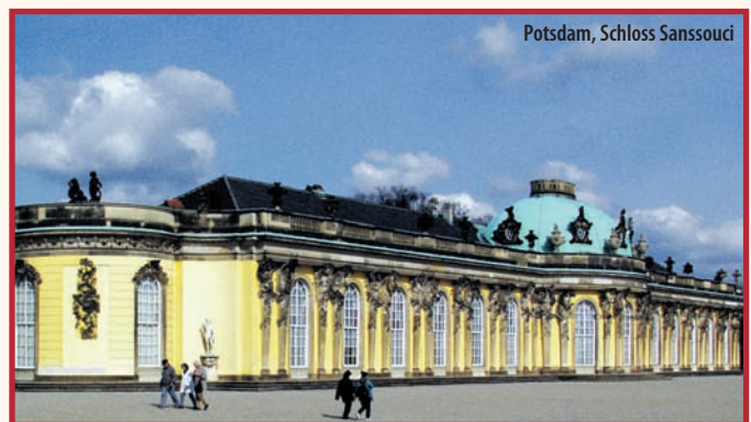
Potsdam, Schloss Sanssouci