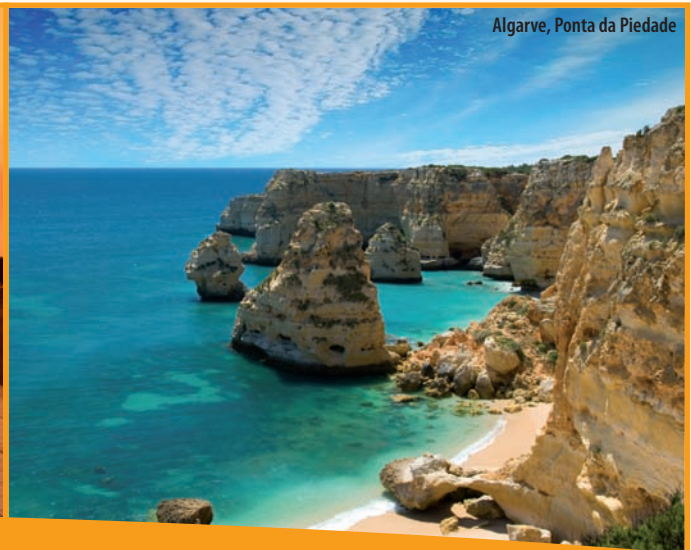
Algarve, Ponta da Piedade

Auf sieben Hügeln ruht Lissabon, die weiße Stadt am Meer mit ihrer tausendjährigen Geschichte. Von hier aus ist der Weg nicht weit zur südlichsten Provinz Portugals – der Algarve. Lassen Sie sich von atemberaubenden Klippen, pittoresken