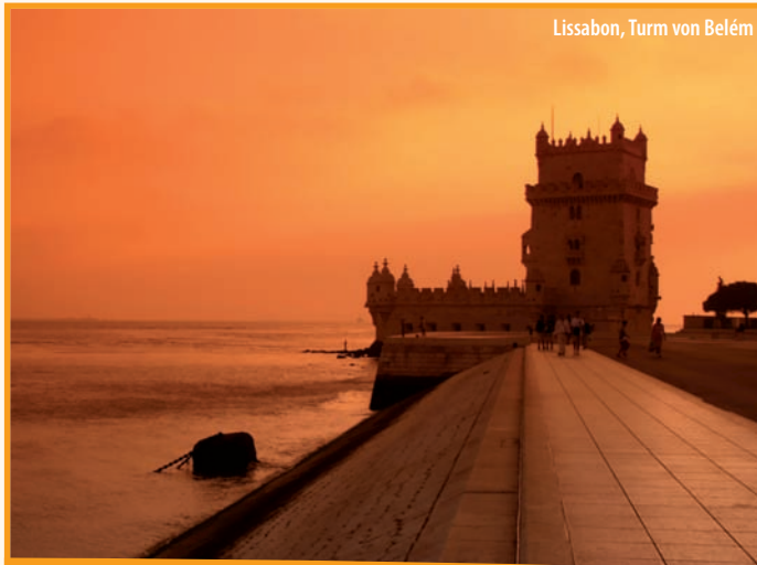
Lissabon, Turm von Belém