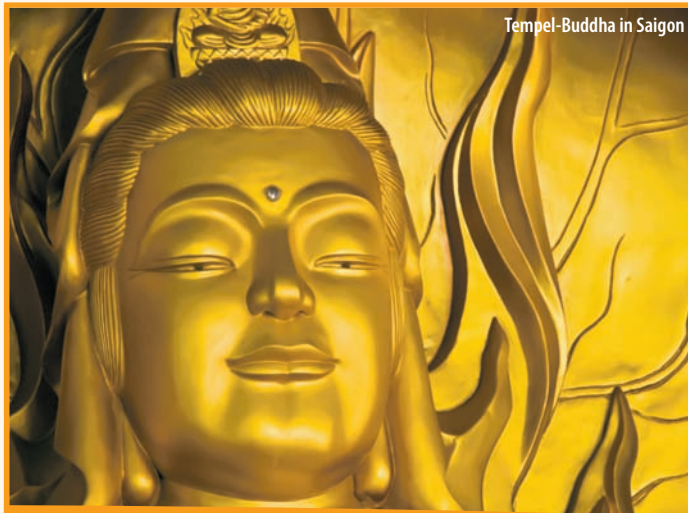
Tempel-Buddha in Saigon