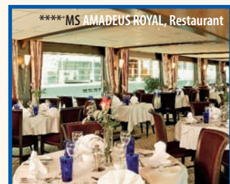
****MS AMADEUS ROYAL, Restaurant