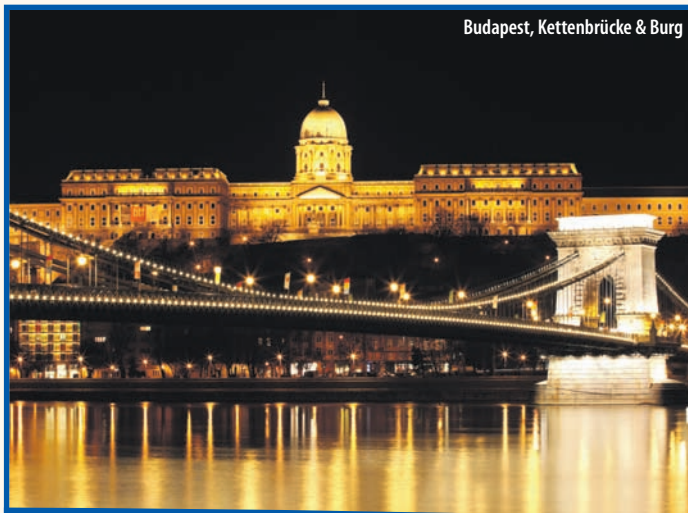
Budapest, Kettenbrücke & Burg