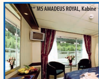
***MS AMADEUS ROYAL, Kabine

Euro, Barzahlung, Kreditkarten (VISA, MasterCard, American Express)