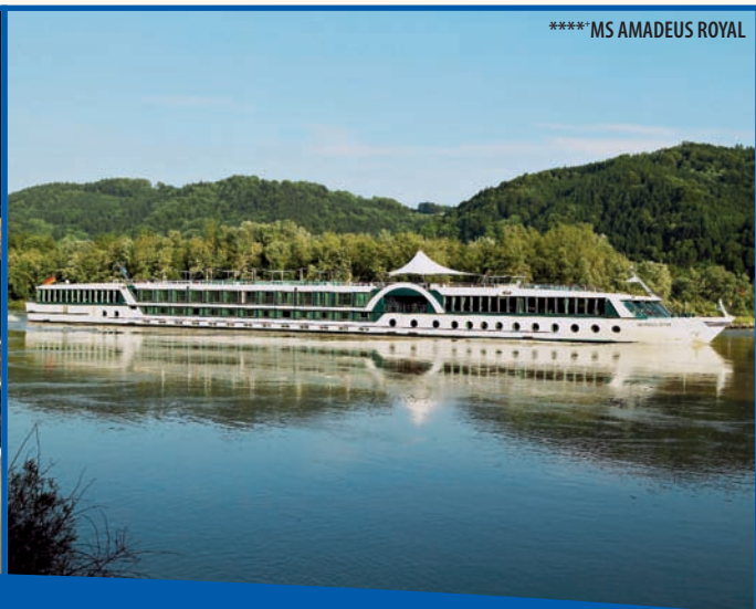
****MS AMADEUS ROYAL

Donau. An keinem anderen Strom findet sich eine solche Vielfalt an Landschaften und stolzen Städten. Abgerundet wird dieses Erlebnis durch den besonderen Service und