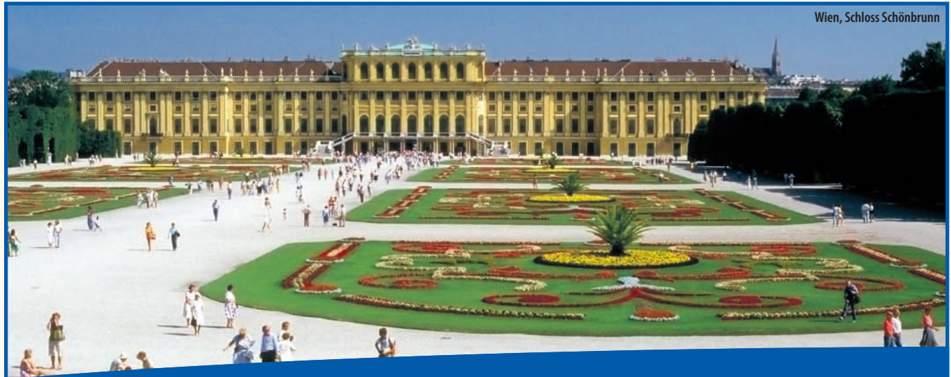
Wien, Schloss Schönbrunn

Mit der MS AMADEUS ROYAL die Donau mit Budapest und Wien erleben