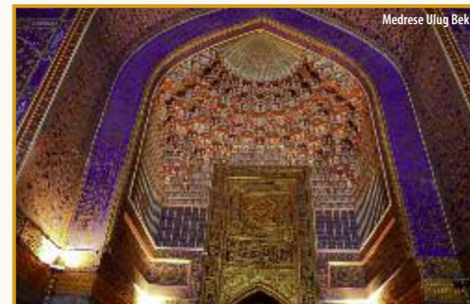
Medrese Ulug Bek

2. Tag: Vor über 2.500 Jahren gegründet rühmt sich Samarkand eines der bekanntesten Wahrzeichen Usbekistans zu sein. Der Registanplatz wurde unter Timur erschaffen und mit drei prächtigen Medresen eingerahmt – der Medrese Ulugbek aus dem 15. Jh. sowie der Medrese Tilla Kori und der Medrese Scher Dor aus dem 17. Jh. Außerdem sehen Sie die von Timur für seine Familie und engsten Freunde erbaute Gräberstadt im Norden Samarkands und das Observatorium des Astronomen Ulug Beg mit dem riesigen in einen Felsen getriebenen Sextanten (Ausflugspaket). Übernachtung und Abendessen in Samarkand.