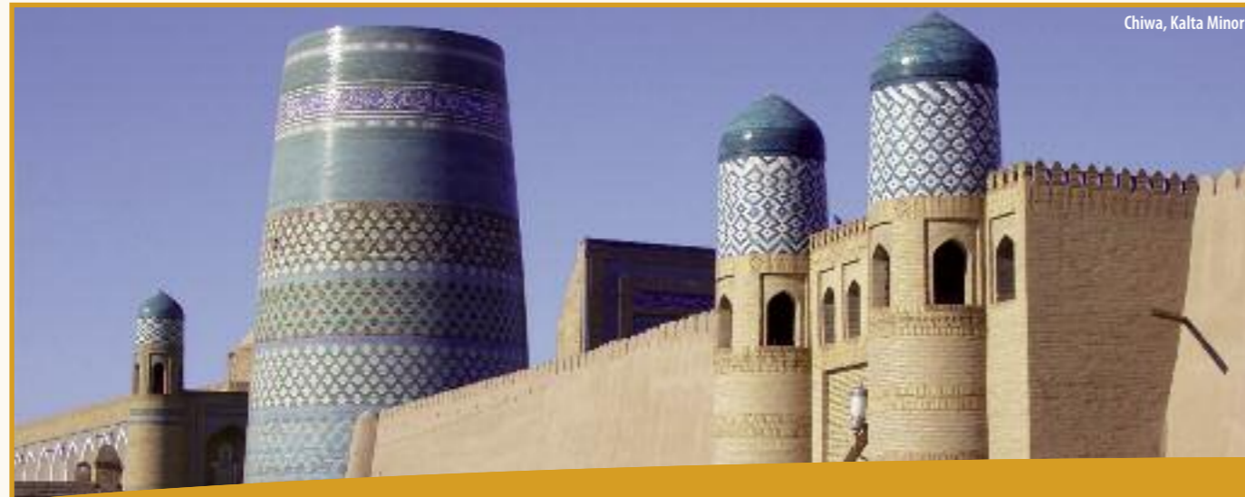
Chiwa, Kalta Minor

Auf den Spuren der Seidenstraße erleben Sie während dieser Reise einen Teil des Zaubers, den diese wohl wichtigste Handelsroute über Jahrhunderte versprühte.