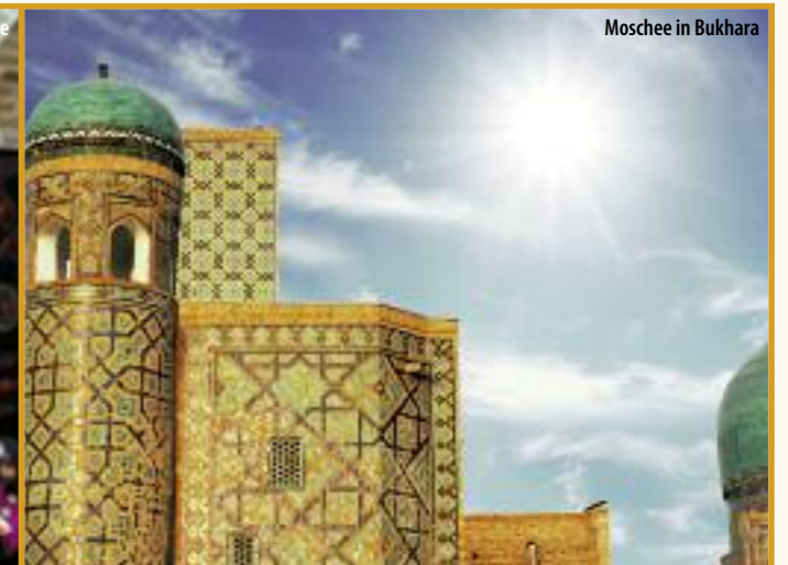
Moschee in Bukhara

tragen. So gelangte der Buddhismus und auch das Christentum bis nach China vor; die Kenntnis von Papier und Schwarzpulver in umgekehrter Richtung nach Arabien und später bis nach Europa. Erleben Sie auf dieser begleiteten Rundreise den