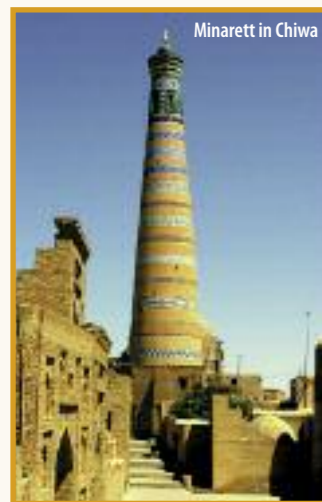
Minarett in Chiwa

1. Tag: Flug vom Flughafen Leipzig nach Samarkand und Transfer in Ihr Hotel. Abendessen.