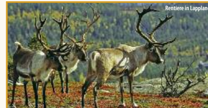
Rentiere in Lappland

røya . Über 300 Meter ragt das berühmte Plateau steil aus dem Eismeer empor – das Nordkap . Von hier haben Sie die beste Aussicht auf die Mitternachts Sonne und genießen den einzigartigen Blick über das Nordmeer. In der Nordkaphalle wird Ihnen als Erinnerung feierlich das Nordkapdiplom überreicht. Am späten Abend fahren Sie zurück zum Hotel auf der Insel Magerøya.