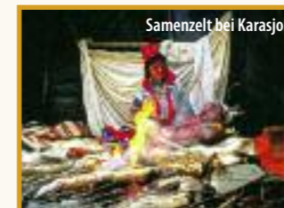
Samizelt bei Karasjok

røya . Über 300 Meter ragt das berühmte Plateau steil aus dem Eismeer empor – das Nordkap . Von hier haben Sie die beste Aussicht auf die Mitternachts Sonne und genießen den einzigartigen Blick über das Nordmeer. In der Nordkaphalle wird Ihnen als Erinnerung feierlich das Nordkapdiplom überreicht. Am späten Abend fahren Sie zurück zum Hotel auf der Insel Magerøya.