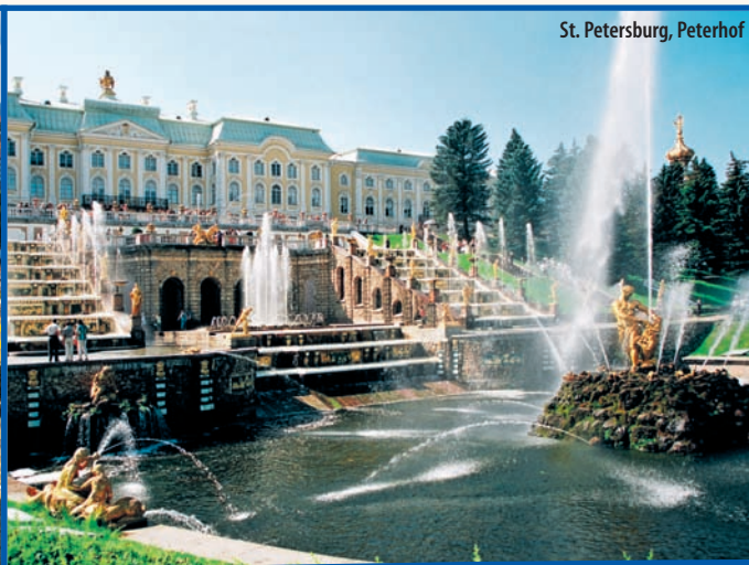
St. Petersburg, Peterhof

Die Magie der Ostseemetropolen entdecken Sie mit der COSTA PACIFICA auf einer wunderbaren Reise- und Kreuzfahrtzeit. Das prunkvolle Schloss Drottning-